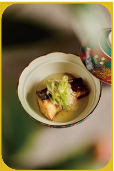
鯔魚 大根 蒜苗 鯔の幽庵焼き

※依據食材狀況、料理部份內容將有變更的可能。 仕入れにより、献立が一部変更になることがあります。